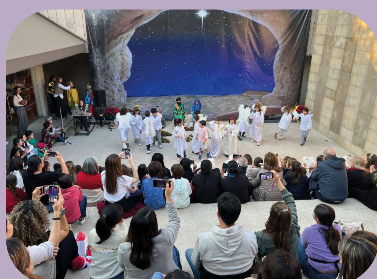
10 de diciembre: Pastorela Escuela de Catequesis