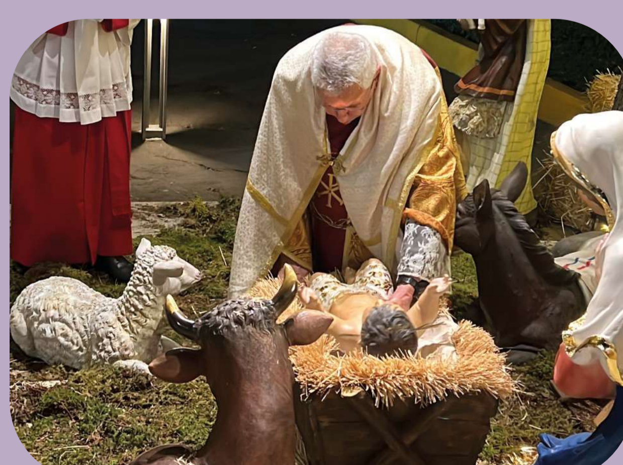
24 de diciembre: Solemnidad de la Natividad del Señor