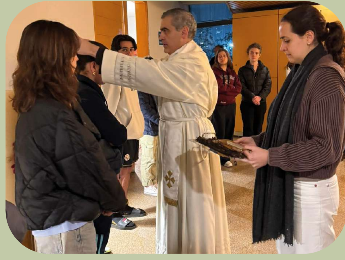
9 de octubre: Efectá, Misa de envío de servidores