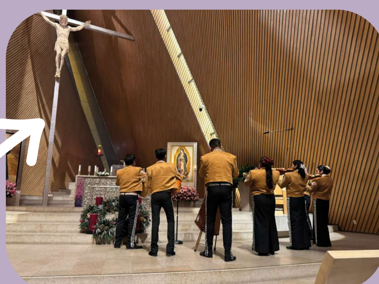
10 de diciembre: Mañanitas a la Virgen de Guadalupe