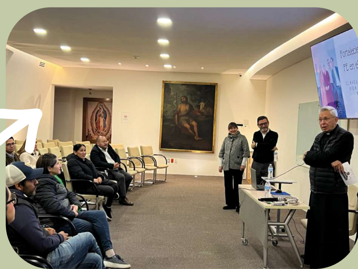
10 de octubre: Plática para papás de niños de la Catequesis