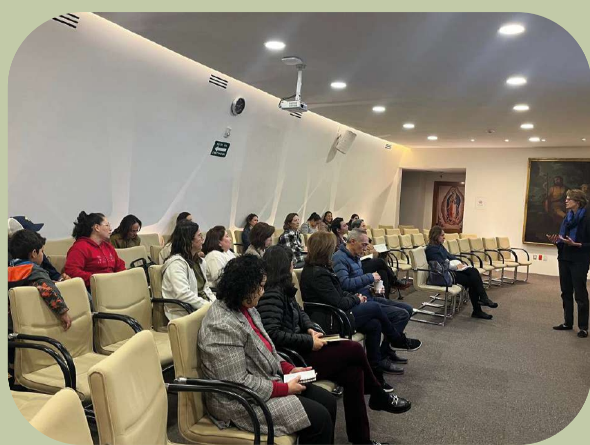
5 de octubre: Curso Básico de Antropología Teológica para Catequistas.