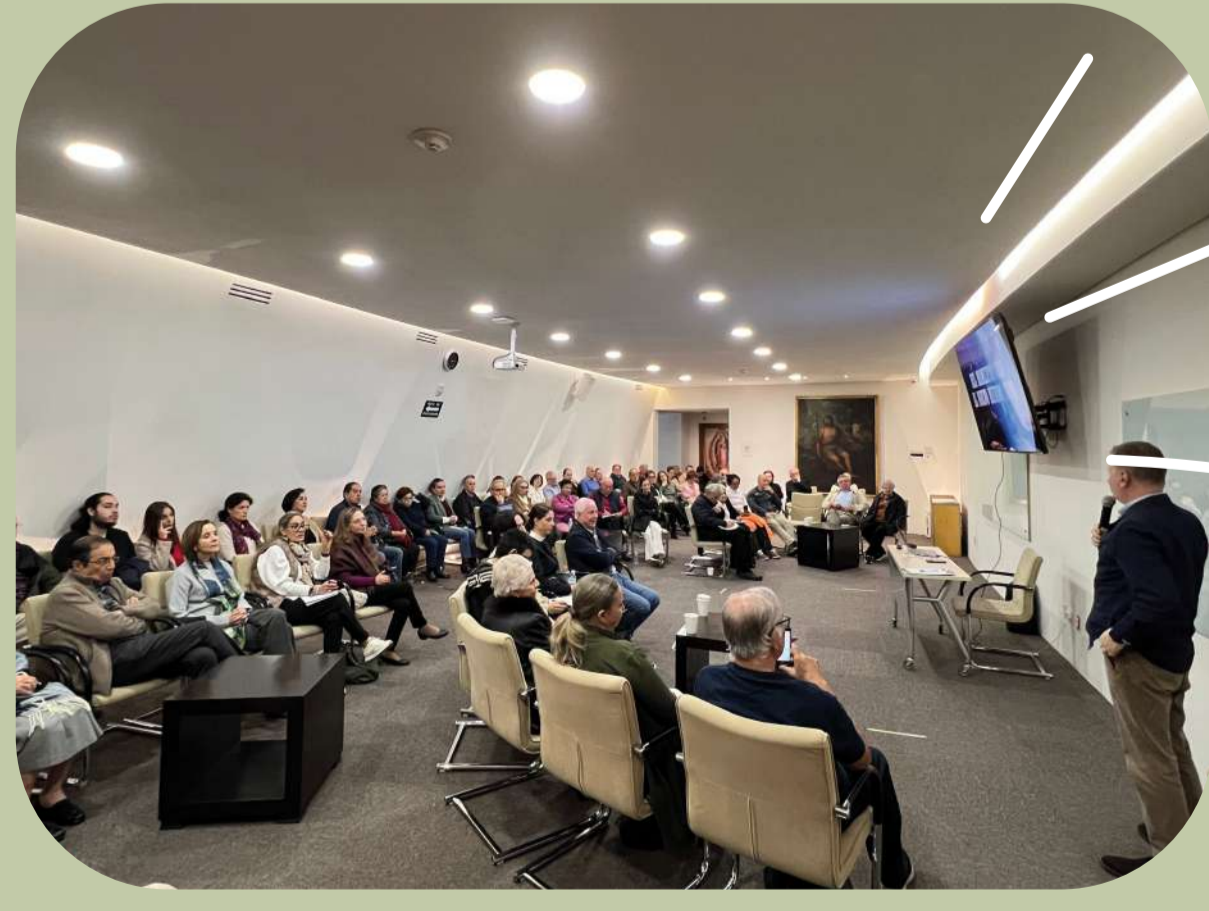
12 de octubre: Vida Plena, Recuperar la esperanza para el cambio de época.